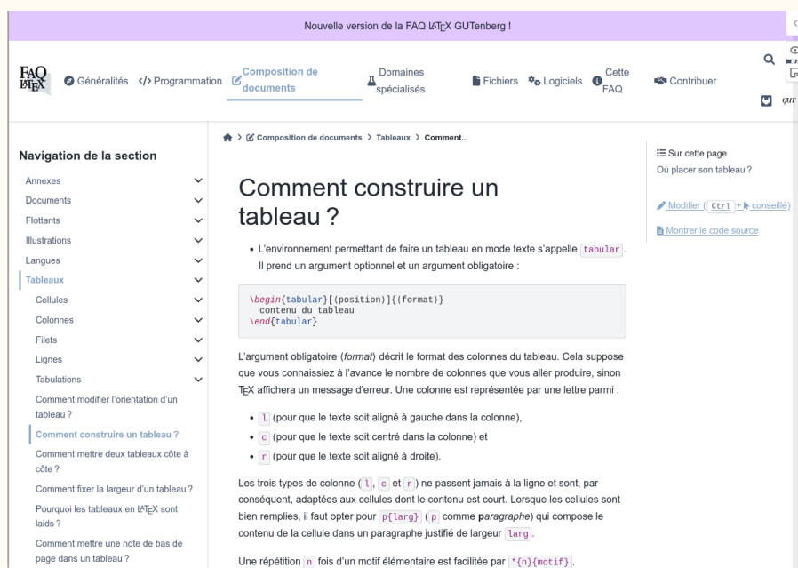
FIGURE 5 – Exemple de page de la FAQ sous Sphinx (vue ordinateur)