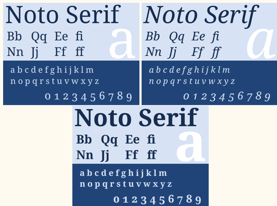
FIGURE 3 – La fonte Noto Serif : caractères romains, italiques et gras.

Comme nous le faisons régulièrement, nous présentons en figure 3 des échantillons montrant la fonte Noto Serif . De la même manière, les figures 4 et 5 page suivante illustrent respectivement les fontes Noto Sans et Noto Sans Mono .