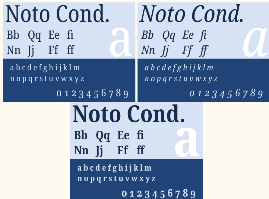
FIGURE 6 – La fonte Noto Condensed : caractères romains, italiques et gras.

Les packages noto-emoji et notoCJKsc fournissent 46 respectivement les fontes en TrueType et OpenType relatives aux émoticônes et aux familles serifs et sans-serifs des fontes pour le chinois traditionnel et simplifié, le japonais et le coréen.