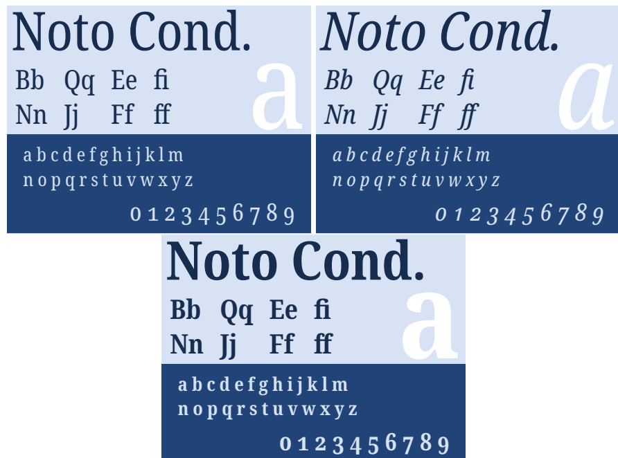
FIGURE 6 – La fonte Noto Condensed : caractères romains, italiques et gras.

Les packages noto-emoji et notoCJKsc fournissent 46 respectivement les fontes en TrueType et OpenType relatives aux émoticônes et aux familles serifs et sans-serifs des fontes pour le chinois traditionnel et simplifié, le japonais et le coréen.