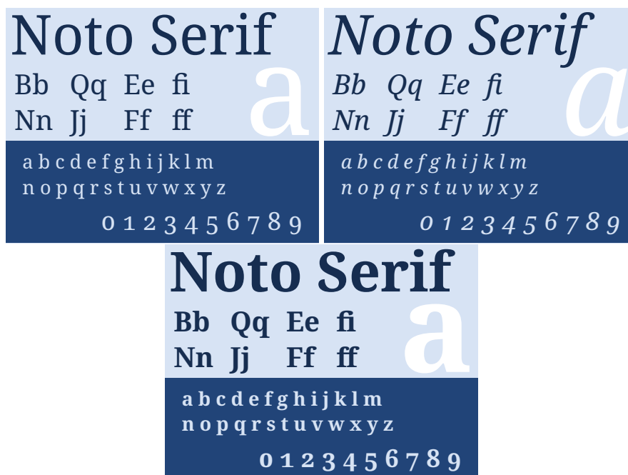
FIGURE 3 – La fonte Noto Serif : caractères romains, italiques et gras.

Comme nous le faisons régulièrement, nous présentons en figure 3 des échantillons montrant la fonte Noto Serif . De la même manière, les figures 4 et 5 page suivante illustrent respectivement les fontes Noto Sans et Noto Sans Mono .