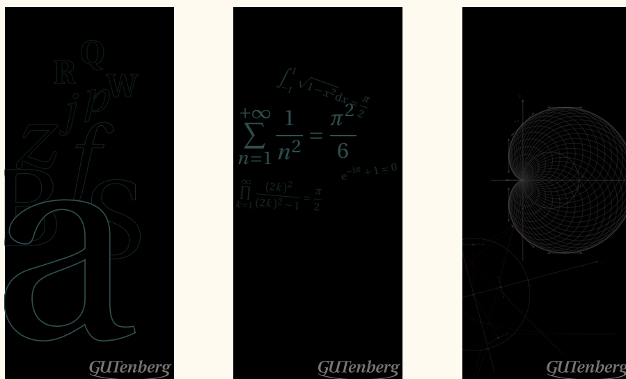
FIGURE 9 – Des fonds d'écran au format smartphone .

Malheureusement, cela n'a pas déclenché de contributions autres que les miennes... mais j'ai tout de même produit les versions pour smartphone ! Peut-être seront-elles utiles. Ces fonds d'écran, volontairement sombres, ont une résolution adaptée aux écrans en question. Ils sont reproduits en ci-dessus et page suivante.