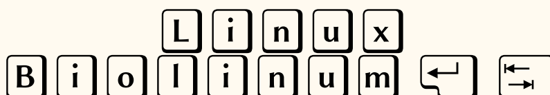
FIGURE 7 – Variante de la fonte Linux Biolinum pour la composition de touche de clavier.

Ce package est utilisable avec les différents moteurs ( tex , pdftex , xetex et luatex ) mais les options ne sont pas toutes utilisables suivant le moteur choisi.